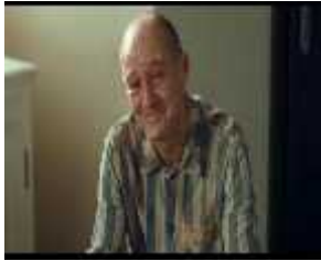
David Hayman als Pavel