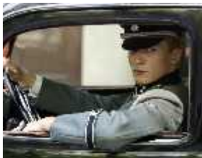
Rupert Friend als Lieutenant Kotler