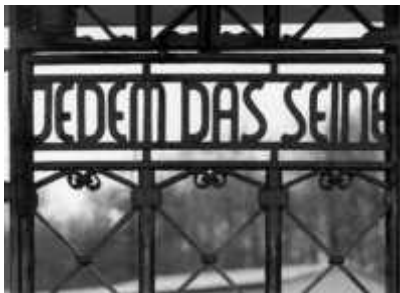
1942 - Duitsland