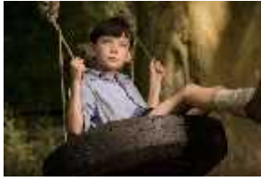
Asa Butterfield als Bruno.