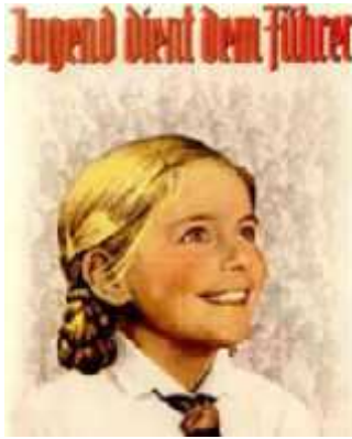
1939 - Duitsland