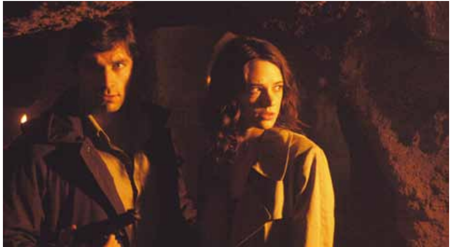
MOTHER OF TEARS

Het hart van Argento's cinema ligt dan ook in zijn werk uit de jaren 70-80; persoonlijke films ("elke schrijver schrijft over zichzelf" aldus Argento) die de auteur tekenden ("elke film veranderde me; wanneer ik een film begin ben